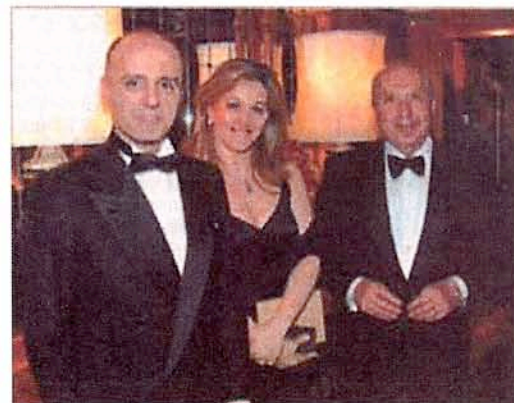
L'ambassadeur du Liban à Washington, M. Antoine Chéhid, et son épouse en compagnie de l'ambassadeur d'Arabie saoudite, M. Adel Joubair.