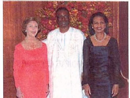
Youssou N'Dour entouré de la « First Lady », Laura Bush, et de la secrétaire d'Etat, Condoleezza Rice.