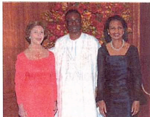
Youssou N'Dour entouré de la « First Lady », Laura Bush, et de la secrétaire d'Etat, Condoleezza Rice.